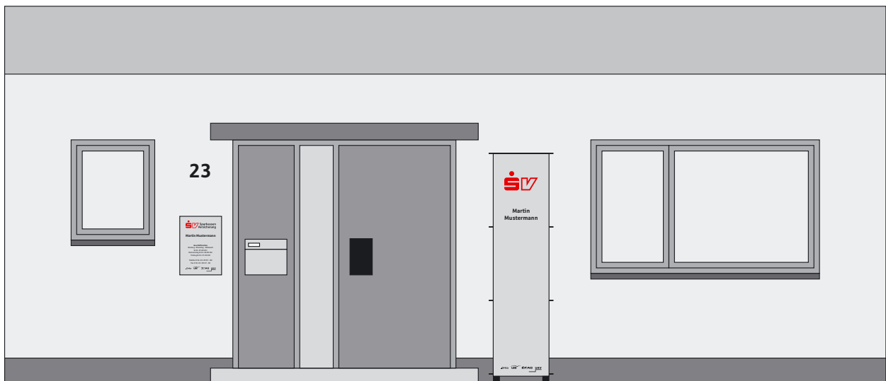
Geschäftsstellentyp C · Ein- oder Mehrfamilienhaus